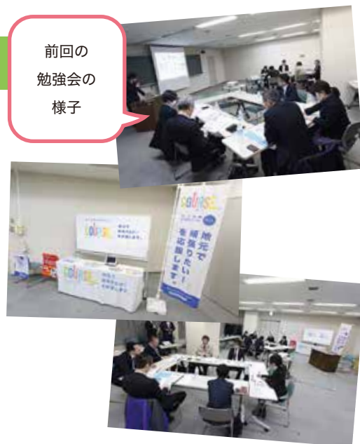
☆前回も大好評!! 勉強会のおすそわけ情報が裏面に載っています。